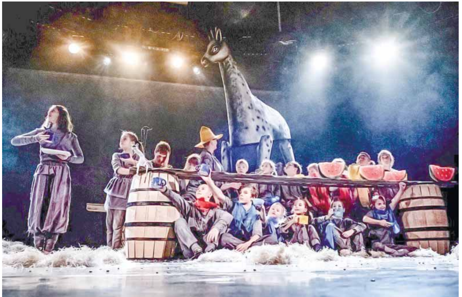
Сцена из спектакля «Сны Пиросмани». / Фото: Андрей Кокшаров.

На Большой сцене Псковского академического театра драмы им. А.С. Пушкина фестиваль «Другое ис-