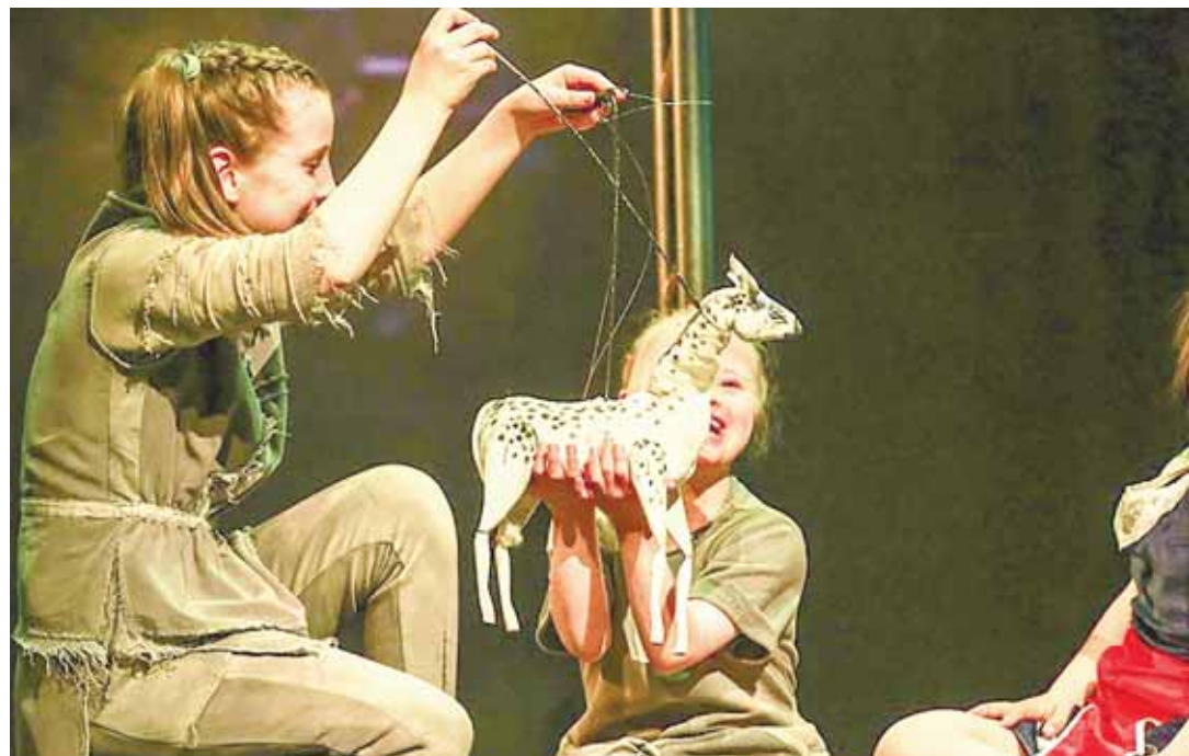
Сцена из спектакля «Сны Пиросмани». / Фото: Андрей Кокшаров.