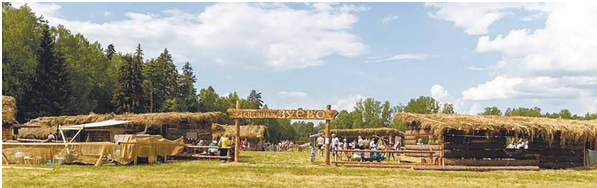
«Деревня Зуёво».