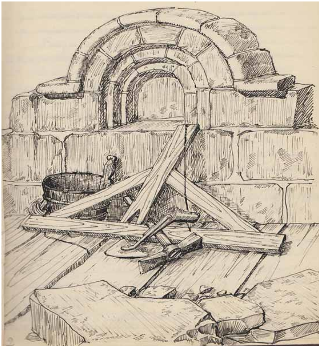
Рисунок Юрия Спегальского из его рабочей тетради, которая хранится в его музее-квартире.

Многие могут посчитать мои комментарии возмутительными, учитывая, сколько времени и сил я потратил на изучение личности Спегальского и его мира. Но эти выводы появились в результате стремления понять этого человека, его эпоху, личную и профессиональную жизнь, от желания приподнять завесу над истиной. К тому моменту, как моё личное представление о Спегальском изменилось, я прошел путь от первоначального «благоговейного восхищения» через «болезненное разочарование» до сегодняшнего «взвешенного уважения» к его личности и его делу, которому он отдал 59 лет своей земной жизни.