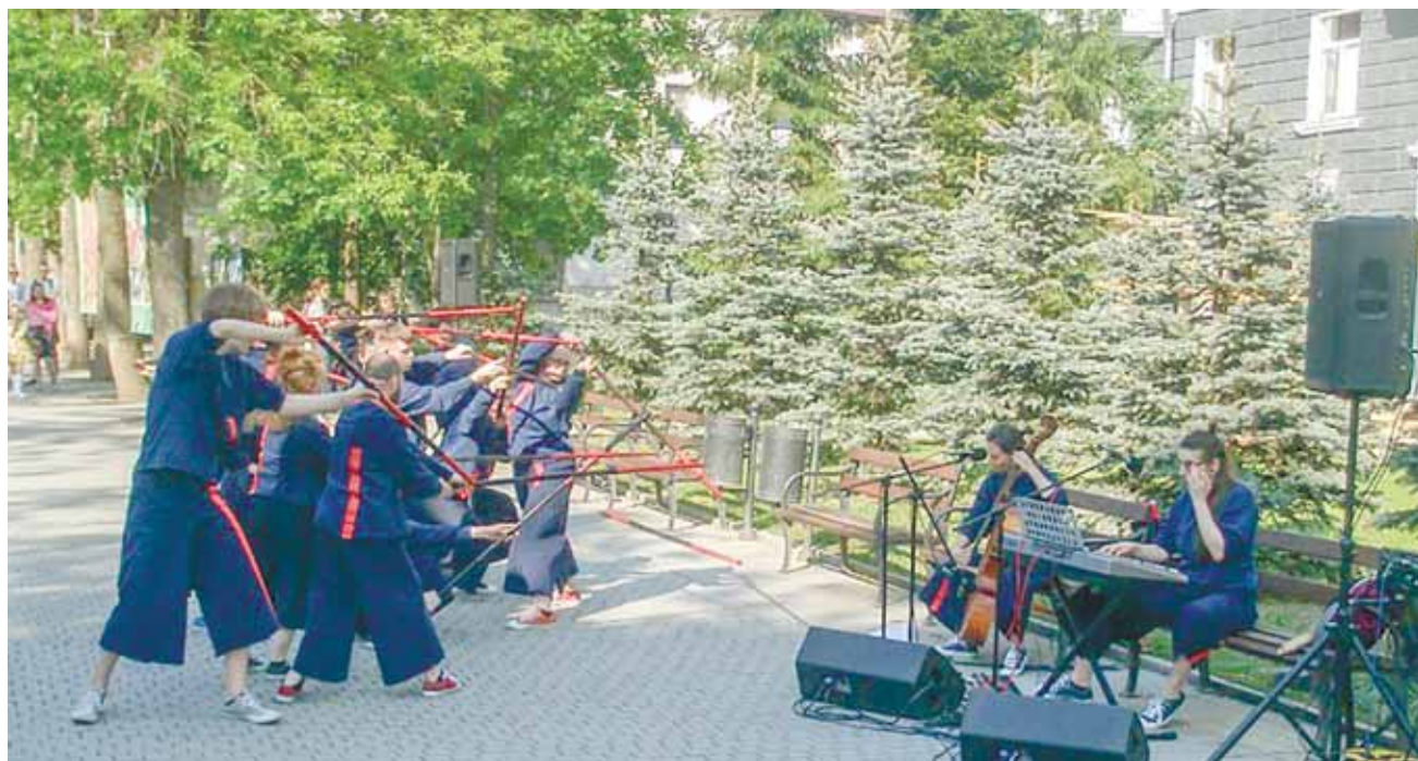
Уличное танцевальное шоу «Грани», Интегрированная театр-студия «Круг II» (Москва).

В ПЕРВЫЙ ФЕСТИВАЛЬНЫЙ ВЕЧЕР НА НЕКОТОРОЕ ВРЕМЯ ПЕШЕХОДНАЯ ЧАСТЬ УЛИЦЫ ПУШКИНА ПРЕВРАТИЛАСЬ В СЦЕНУ, на которой с шестью танцевали участники московской интегрированной театр-студии «Круг II». Это было шоу «Грани» под живую музыку. Древние ритуальные кельтские, шотландские, африканские танцы. И вдобавок танцы несуществующих народов.