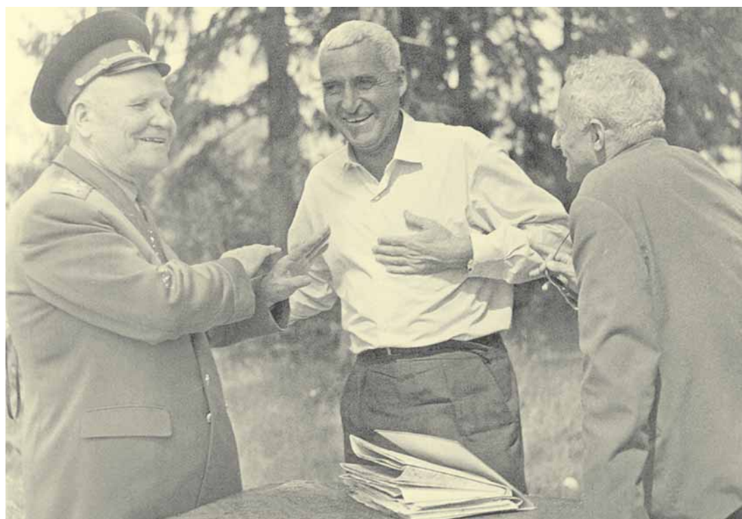
И.С. Конев, К. Симонов и Е. Воробьев в Подмоскovie. Конец 1960-х гг.