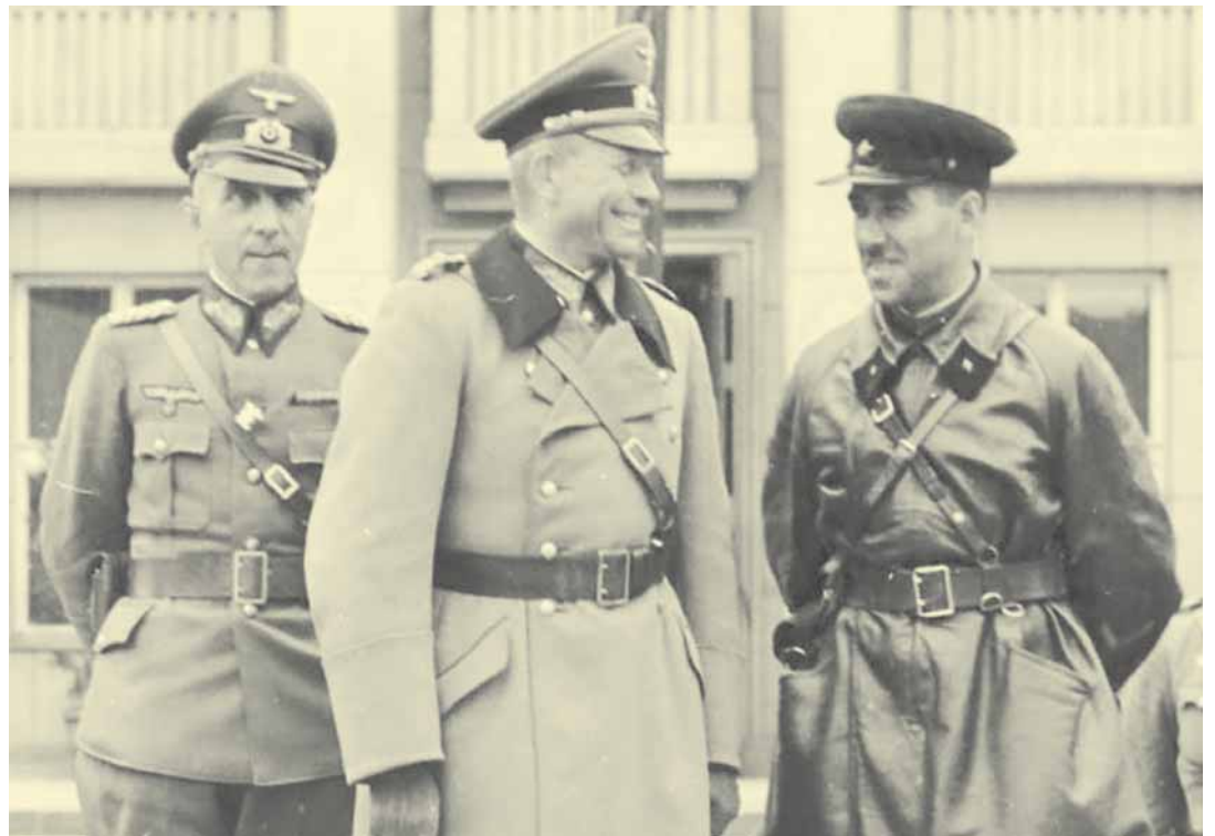
Гейнц Гудериан (в центре) и Семён Кривошеин (справа). Брест, 22 сентября 1939 года.

К тому же не следует вырывать из исторического контекста одно-единственное событие и рассматривать его отдельно. Важно знать, что этому параду (проводам) предшествовало и что последовало за ним.