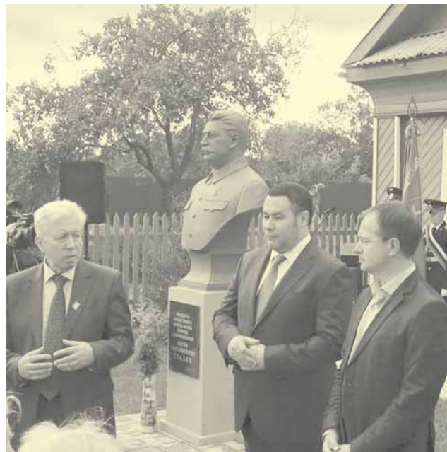
Министр культуры РФ Владимир Мединский во время открытия бюста Сталина в деревне Хорошево Ржевского района Тверской области. 2016 год.