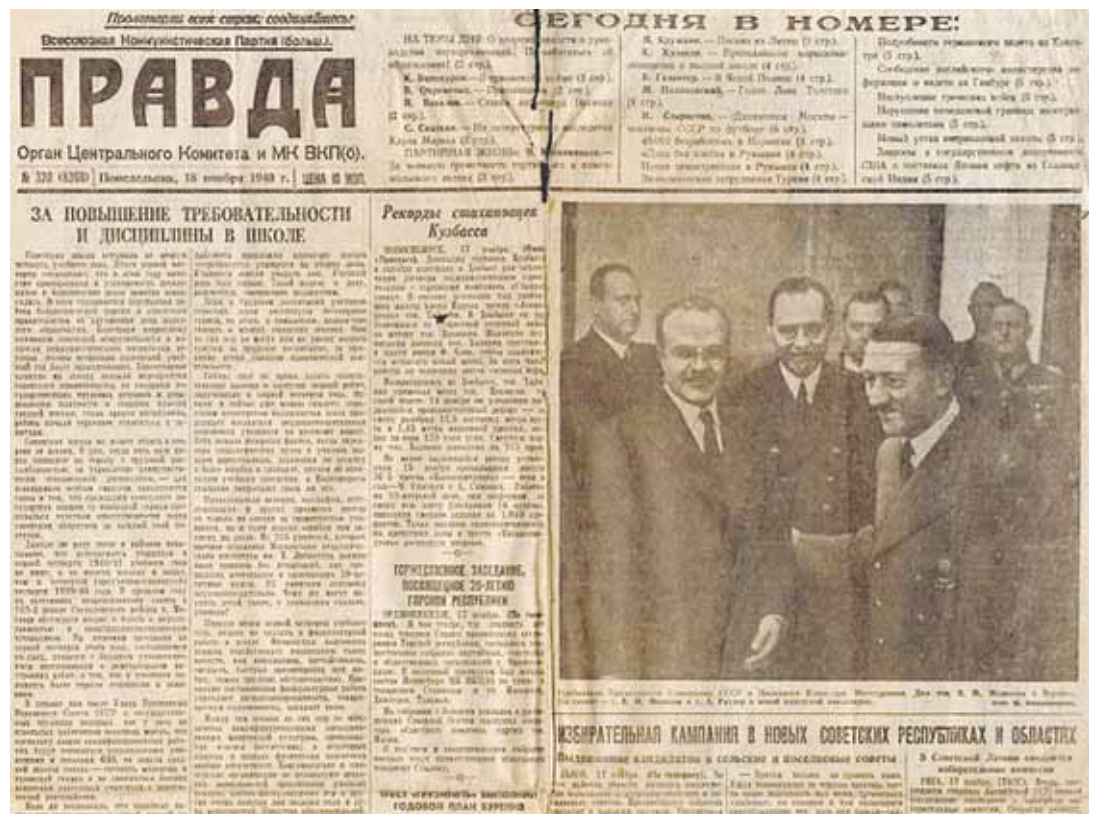
Первая полоса газеты «Правда», 18 ноября 1940 года. № 320 (8366).

В августе 1940 года ледоколы «Ленин», «Сталин» и «Лазарь Каганович», по очереди передавая друг другу, провели немецкий вспомогательный крейсер «Комет» через Ледовитый в Тихий океан (на помощь